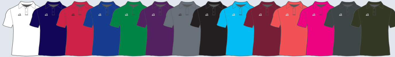
01. ホワイト 02. ナイビー 03. レッド 04. ロイヤル 05. グリーン 06. パープル 07. グレー 09. ブラック 10. ターコイズ 12. ガンディ 14.Sオレンジ 16. ホットピンク 17.D グレー 20.AMグリーン

★ ALAP-001BEI CHINOLIKE Shorts ¥4,950(税込) ★ DRY チノライクアスリートショーツ (サイズ: S,M,L,O,XO)